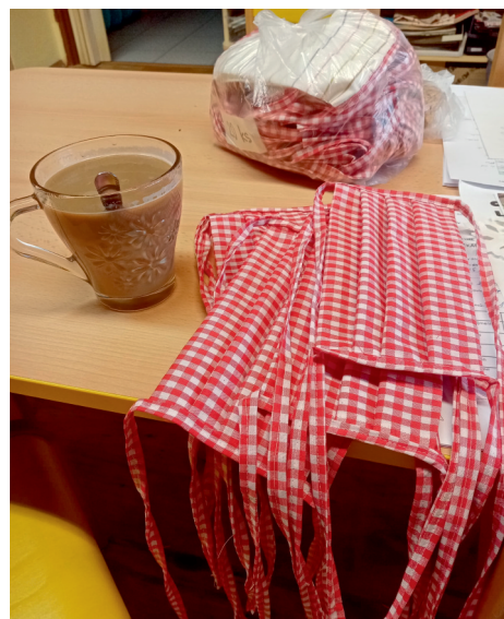
Roušky ušité v mateřské škole

Hluboká poklona pro ty ženy, které roušky šily. Máme teď dokonce i zásobu. Kdyby náhodou ještě něco bylo, tak jsme na to připraveni po všech stránkách. Máme dezinfekci, roušky navíc. I ty, které jsme nakoupili. Z této jarní situace máme jedno velké ponaučení: