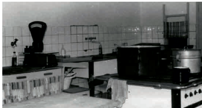
Kuchyně v roce 1972

z Polska, podobně se tak stávalo i v jiných podnicích po celé republice. Do výroby docházelo pracovat také 20 důchodců. Stravování pracujících bylo tehdy zajištěno díky závodní kuchyni, jak ji můžete vidět na následujícím snímku.