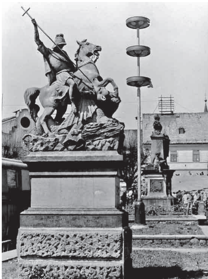
O pouti v roce 1965