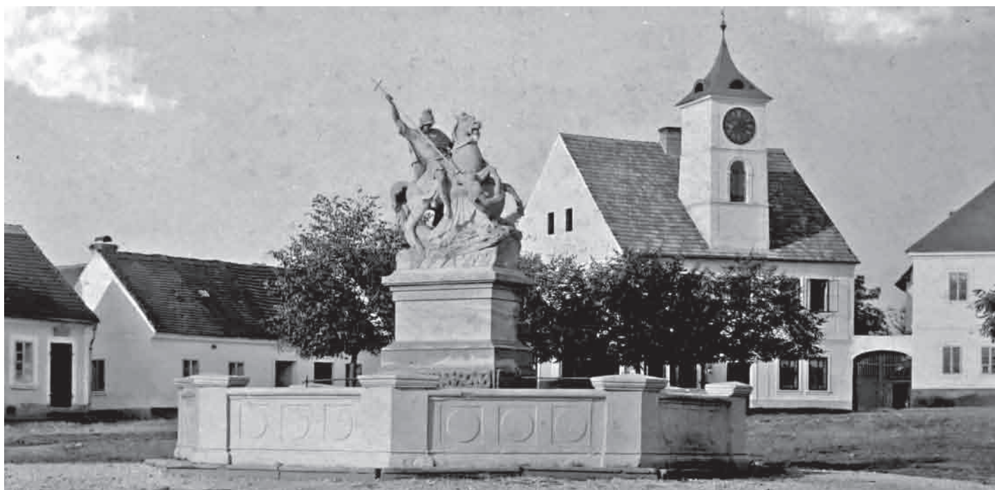
Socha krátce po umístění na kašnu v létě 1892

Zajímavostí může být, že profesor Moric Černil plánoval využít figuru draka jako vodní chrlič.