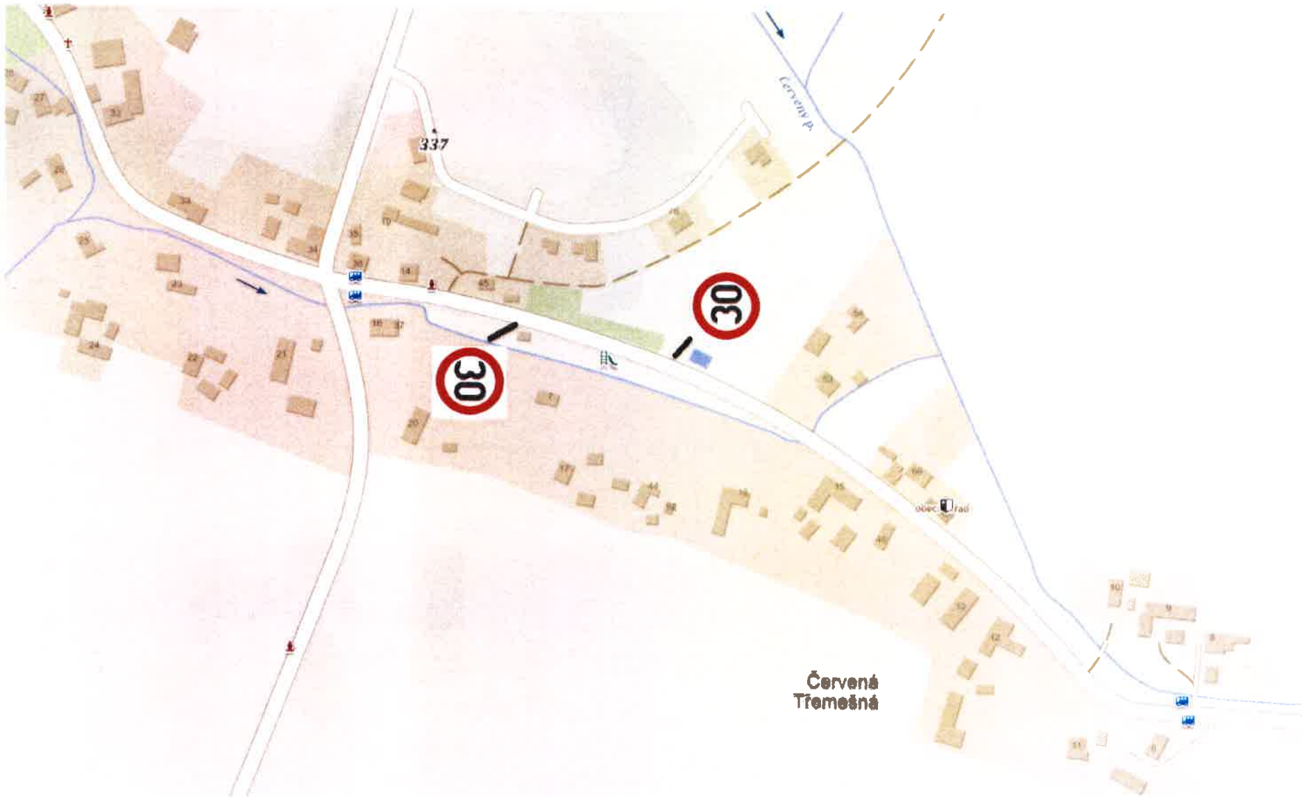
Červená Třemešná, silnice č. III/3004, úsek u dětského hřiště 3.4.-16.7.2023